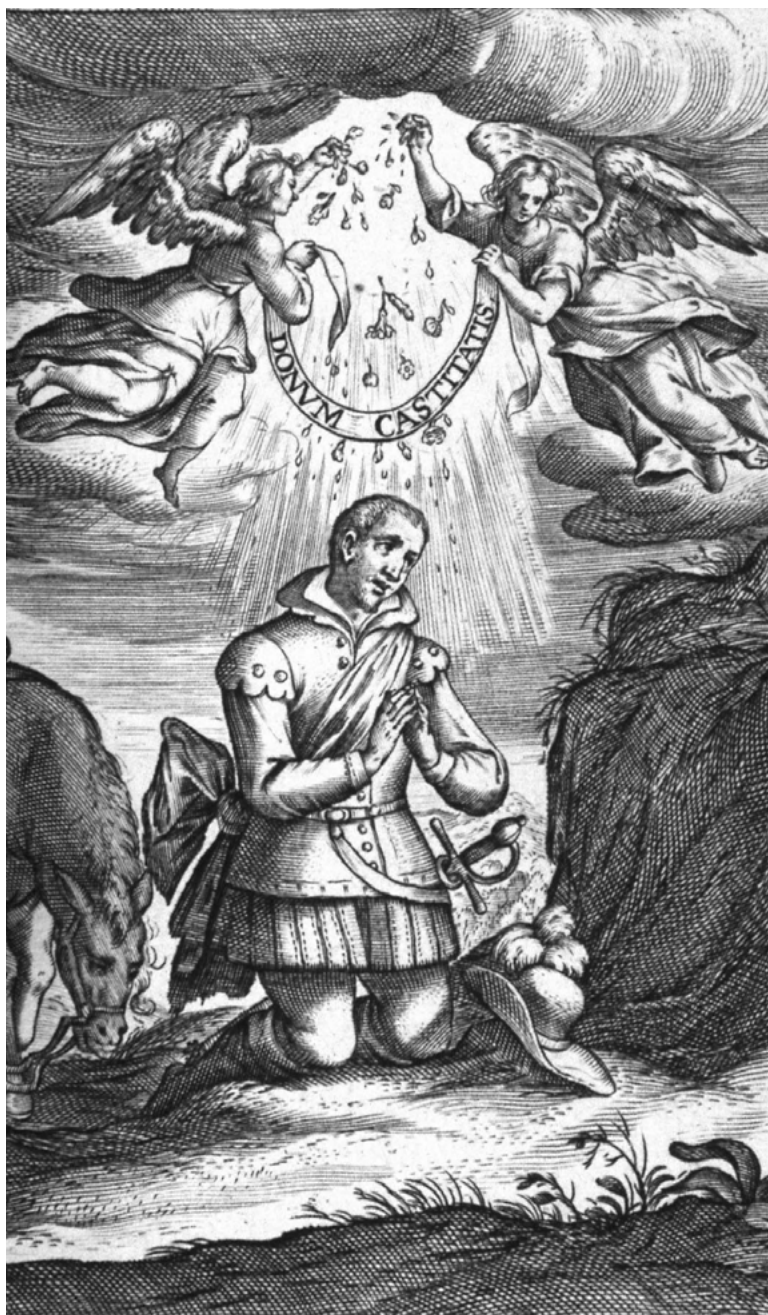
Sv. Ignác z Loyoly