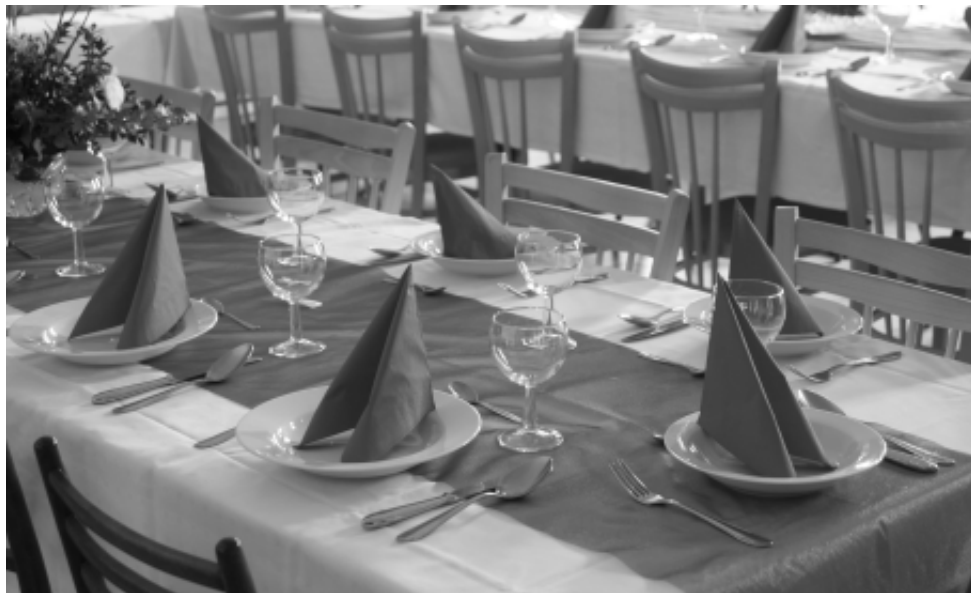
Červeno-bílá sváteční tabule pro naše biřmovance.