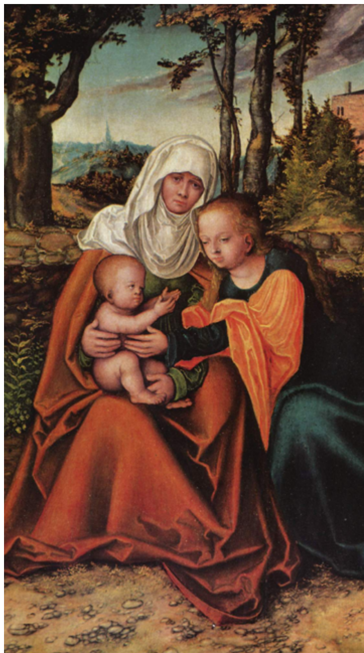
Svatá Anna s Marií a Ježíškem

Milí farníci, prostřednictvím Farního listu vás na prahu podzimu všechny zdravím a připomínám důležitou událost naší české a moravské Církve, která je před námi – Národní eucharistický kongres. Ten vyvrcholí v sobotu 17. října v Brně společnou mší sv. a následným průvodem s Eucharistií. Proč tento kongres naši biskupové vyhlásili? Hlavním cílem je veřejně vyznat a především posílit a prohloubit lásku k Pánu Ježíši v Eucharistii. Proto jsme také během roku mluvili o mši svaté, abychom ji lépe chápali a také lépe prožívali. Ježíš v Eucharistii je zdrojem a vrcholem života Kristovy Církve, tedy i křesťanského života každého z nás.