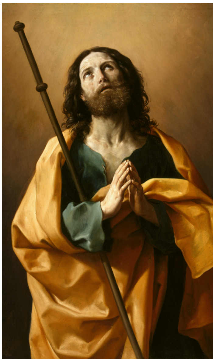
Svatý Jakub Starší

Důležitá otázka při každé autonehodě: Kdo to zavínil? A nebývá to vždy ten druhý. Buď čestný, každý může chybit.