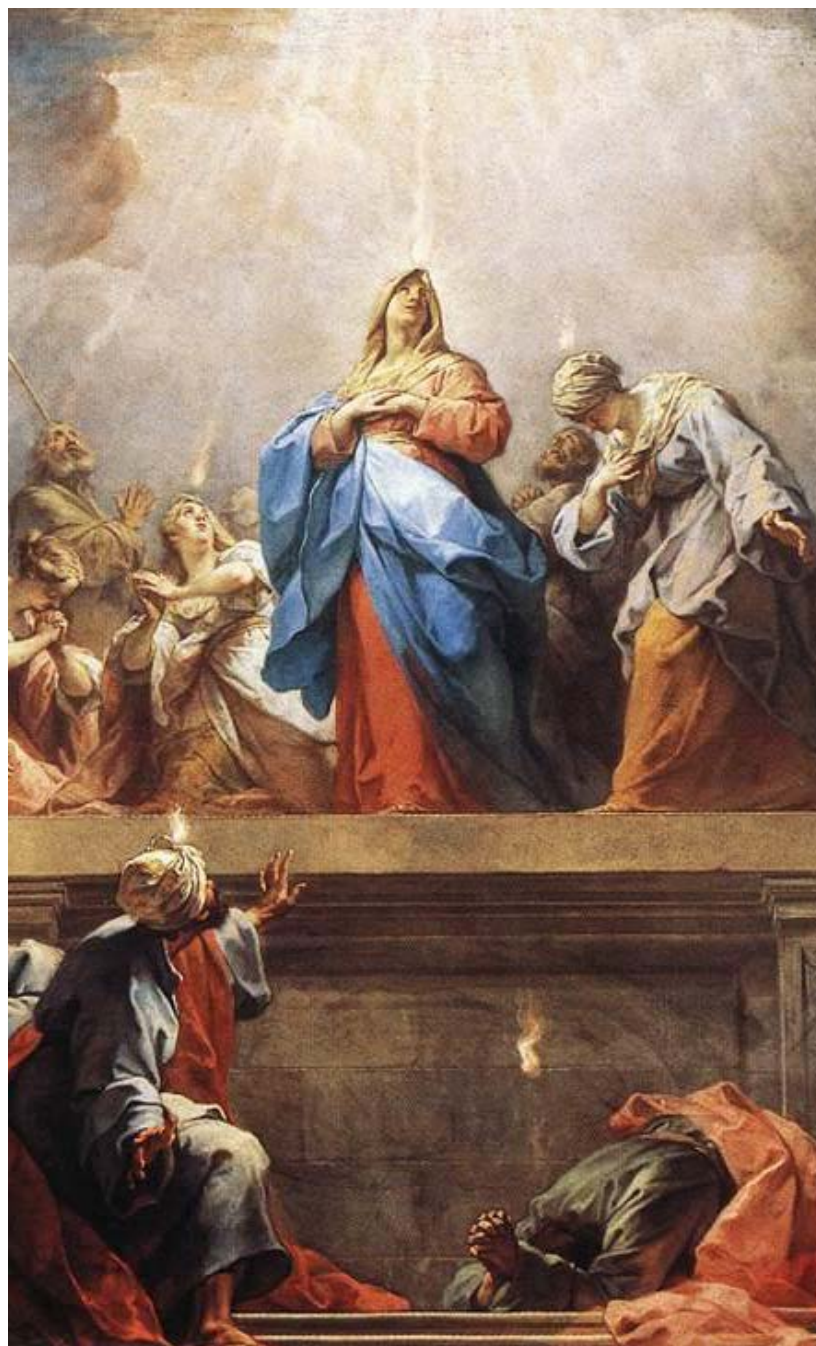
Seslání ducha svatého