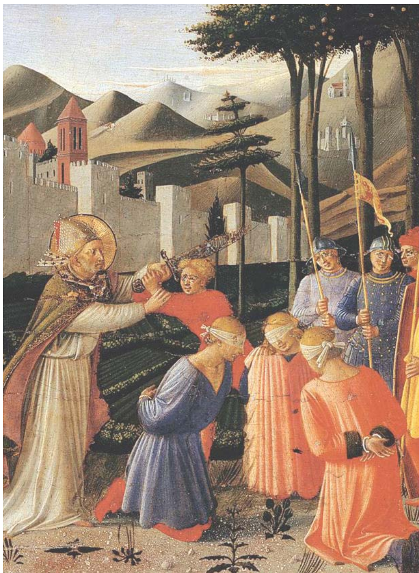
sv. Mikuláš osvobozuje tři nevinné